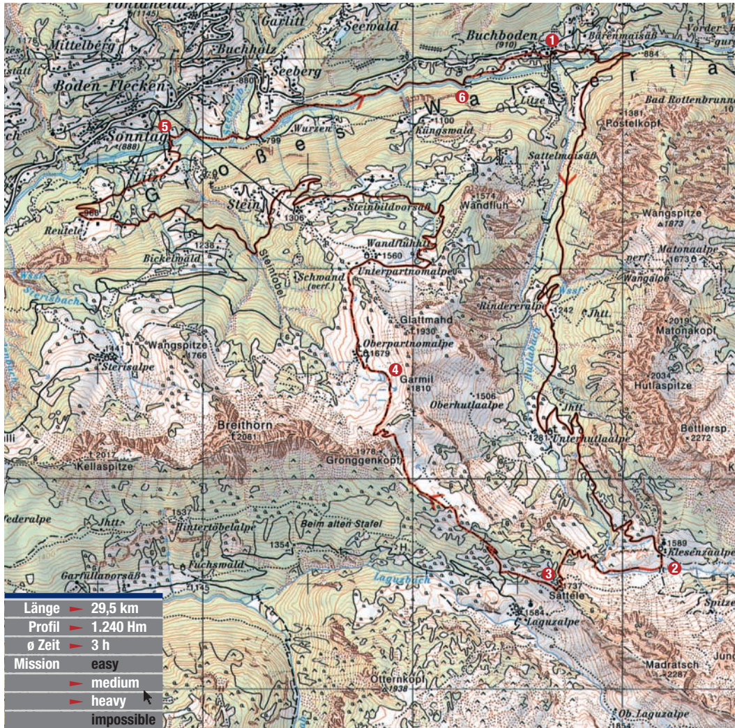
© BEV – 2002, vervielfältigt mit Genehmigung des BEV – Bundesamtes für Eich- und Vermessungswesen in Wien, Zl. 2003/00550.