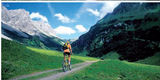
Biken in herrlicher Hochgebirgslandschaft und ein ordentliches Tragestück verleihen der Tour zur Klesenza Alpe Charakter.